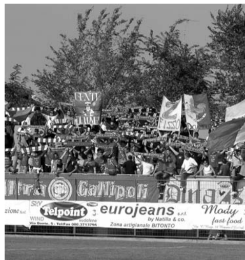
Niente carovana per la trasferta di Foggia

GALLIPOLI - Come sempre il Gallipoli nella trasferta contro la capolista Foggia potrà contare sull'apporto dei propri tifosi che si stanno organizzando per poterla seguire anche nelle trasferte più lontane. Purtroppo, però, contro la formazione dauna non si potrà contare sui pullman organizzati dal club Cucs-Francesco Bello - Gallipoli perché, come fanno sapere dal club sportivo, i costi per la trasferta erano talmente elevati che non si è potuto organizzare nessun pullman ma ognuno si sta organizzando con mezzi personali per poter seguire la compagine giallorossa. Infatti, ogni manifestazione, coreografia allo stadio o trasferta che sia questa viene organizzata sempre con soldi personali dei soci dei club sportivi cittadini senza che vi sia alcun tipo di sovvenzionamento. E se da un lato questo fa onore agli ultras dall'altro rende troppo onerose alcune iniziative come può essere, appunto, l'organizzazione di una trasferta a Foggia. Insomma, la passione per il Gallipoli è sempre viva, ma bisogna fare anche i conti con le tasche di ognuno. Il Gallipoli sta ben figurando e questo è di ulteriore stimolo per i suoi supporter, soprattutto per quelli che gli sono sempre vicino e non lo mollano nemmeno nei momenti difficili. Il Foggia è lanciato più che mai in classifica e potrà contare sull'apporto del grande pubblico che in