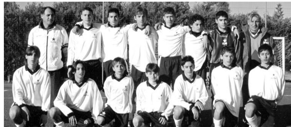
I giovanissimi della Pro Italia Galatina stanno disputando una stagione eccellente