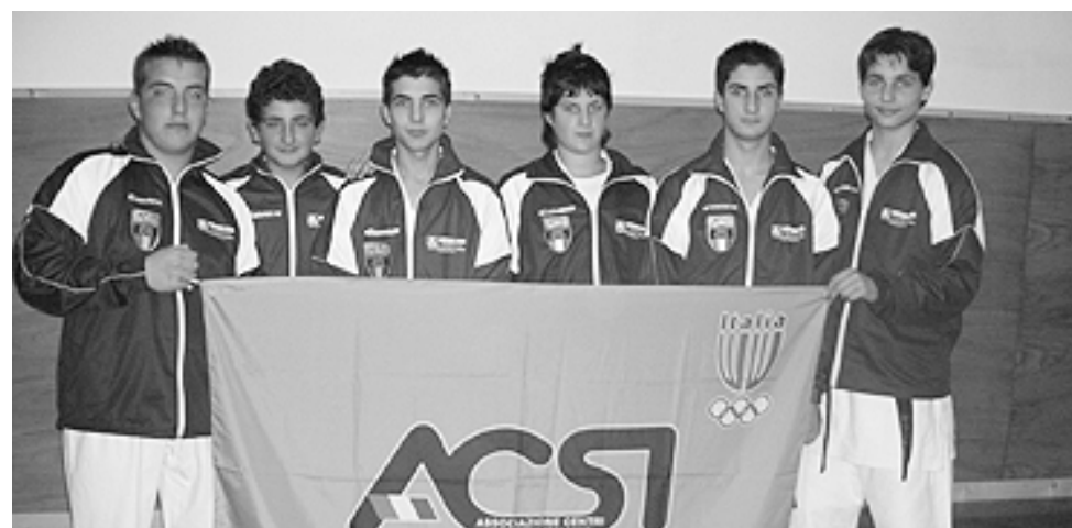
Bilancio positivo per gli atleti dell'Acsi nel trofeo Osci